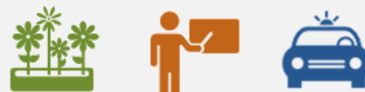
שיטור | חינוך ביתי | גינון קהילתי

התנהגות של מושאי מדיניות אשר אינה עולה בקנה אחד עם המדיניות הקיימת מגלמת חוסר היענות למדיניות (Policy non-compliance). המוטיבציות לחוסר היענות הן שונות ומגוונות, ולפי התפישה הרווחת זוהי תופעה שלילית המשקפת בעיית יישום. בהתאמה, החשיבה המסורתית גורסת כי תגובת השלטון לחוסר היענות היא הגברת האכיפה או נקיטה באמצעים שונים על מנת למגרה, דהיינו על מנת לשנות את התנהגותם של מושאי המדיניות כך שתעלה בקנה אחד עם המדיניות. המחקר הנוכחי מעלה תובנה לפיה תופעת חוסר היענות עשויה להיות זרו לשינוי מדיניות ודרך נוספת של האזרח להשפיע ולהיות מעורב בקביעת המדיניות. דוגמאות נפוצות: