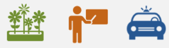
שיטור | חינוך ביתי | גינון קהילתי

התנהגות של מושאי מדיניות אשר אינה עולה בקנה אחד עם המדיניות הקיימת מגלמת חוסר היענות למדיניות (Policy non-compliance). המוטיבציות לחוסר היענות הן שונות ומגוונות, ולפי התפישה הרווחת זוהי תופעה שלילית המשקפת בעיית יישום. בהתאמה, החשיבה המסורתית גורסת כי תגובת השלטון לחוסר היענות היא הגברת האכיפה או נקיטה באמצעים שונים על מנת למגרה, דהיינו על מנת לשנות את התנהגותם של מושאי המדיניות כך שתעלה בקנה אחד עם המדיניות. המחקר הנוכחי מעלה תובנה לפיה תופעת חוסר היענות עשויה להיות זרו לשינוי מדיניות ודרך נוספת של האזרח להשפיע ולהיות מעורב בקביעת המדיניות. דוגמאות נפוצות: